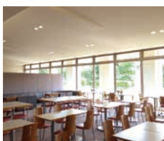
レストラン・交流サロン