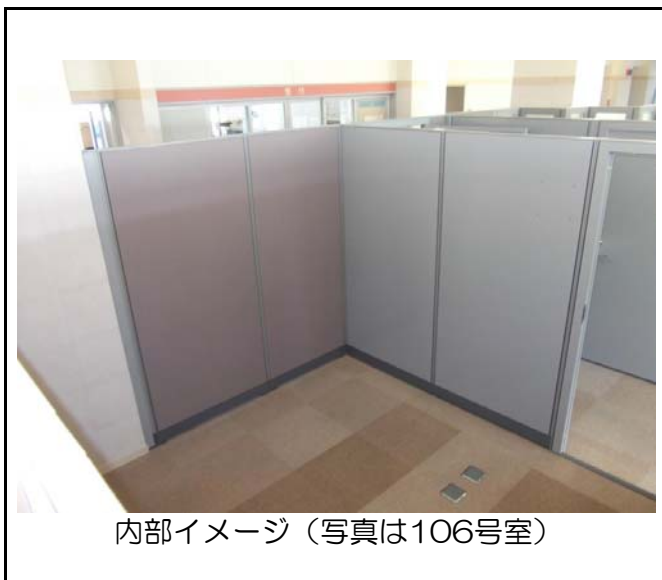
内部イメージ (写真は106号室)